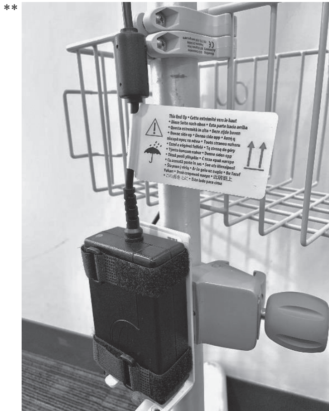
図3 正しい向きに取り付けられた電源アダプタ

** 5. IPX1耐水を確保するため、モニタ、電源アダプタおよびデータボックスは垂直に設置してください。装置の向きが正しくない場合、発煙、スパーク、または火災の原因となる可能性があります。