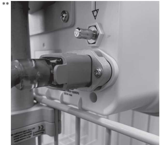
図4 ポンプユニット電源コード入力カバー