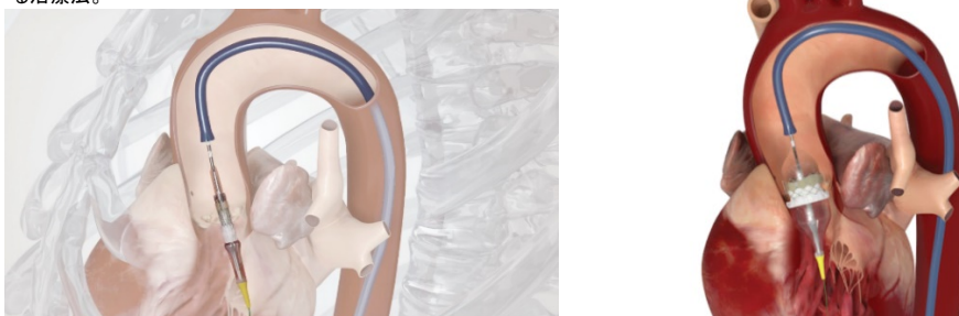
折りたたんだ生体弁を、カテーテルで心臓の中に運ぶ様子(左)とバルーンで膨らませた様子(右)

*1 TAVI(タビ)とは: Transcatheter Aortic Valve Implantation の略称。開胸手術をすることなく、カテーテルで患者さんの血管を通じて生体弁を心臓の中まで運び、留置する治療法。